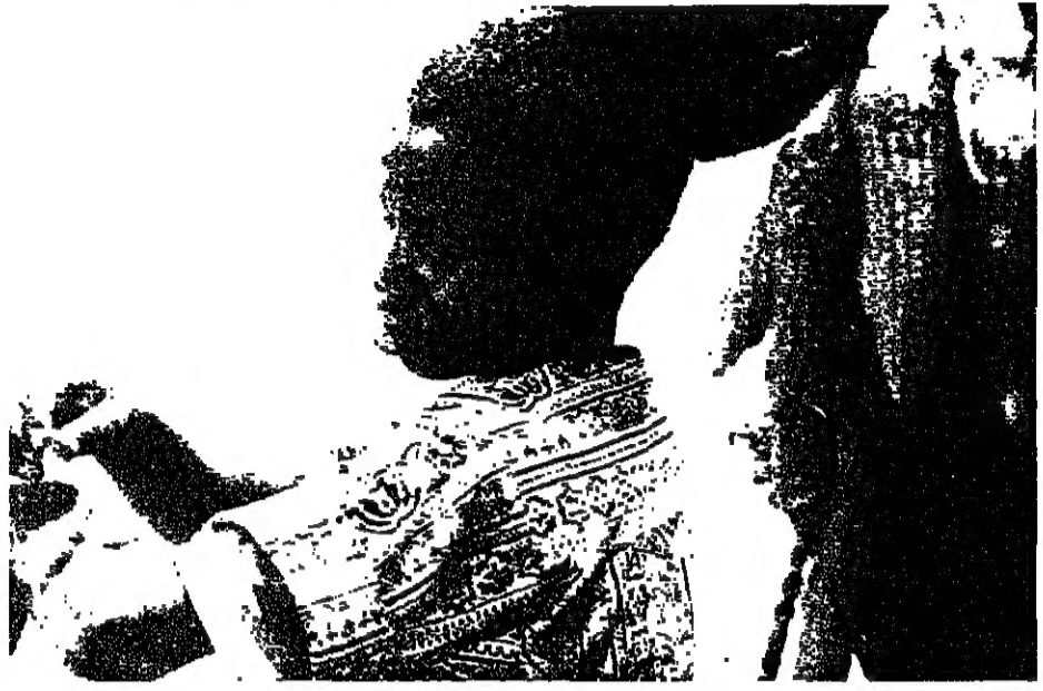
لقطة أخرى من «الخيار» إيفا

بساطة، نحاول تقاسم أفكارنا ومشاعرنا. وهذا الجمهور يمكنه المتابعة، هذا جيد. ● في «Yamba» الولد شخص يتعلم النظر... □ أجل، إنه نظري في الفيلم، نقطة ارتباطي مع الماضي، كنت مرغماً على بناء القصة بسبب نوعية اللعب طريقة في التصرف كانت صحيحة إلى حد أنها أصبحت نقطة ارتكازي، أنها شخصية محفوظة أيضاً بامتلاك أم رائعة، عندما يقول والد بيلا، يقول لامرأته، ذلك التي من نيك الأم، هذا لأن كل التربة الأساسية تتحقق مع الأم، الولد هو الذي يتعلم، لا يأتي عقوباً إلى تلك المرأة العجوز وفي البداية، أنه قسراً مثل الآخرين لأنه يحكم (على الناس)، هو أيضاً، لكنه في الوقت عينه، طيب ومتسامح، أنه أيضاً، الذي يقول للمدمن على الكحول، تريد مرافقتي، توقف عن الشراب، إنه مثالي، أنه ليس الطهارة للطفلة لكنه يقود عالم الفلم.